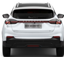
מגוון אביזרי נוחות ומיגון