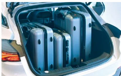
שדרוג נפח אחסון תא מטען