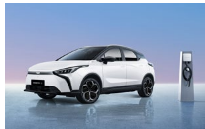
מגוון אביזרים משלימים לטעינה

*השירותים כרוכים בתוספת תשלום וכפופים לתנאי השירות הנבחר.