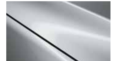
כסף אפרפר (38P)