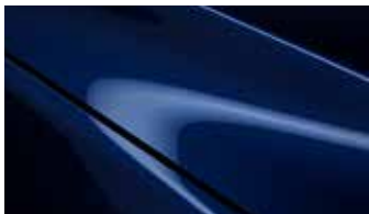
כחול קריסטל כהה (42M)