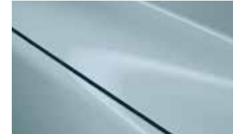
כחול סלסטה (52L)