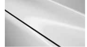
לבן פנינה (25D)