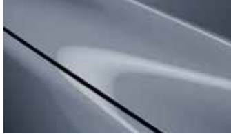
כחול מתכתי (47C)