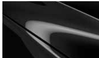
שחור (41W) לא זמין ברמת גימור Dynamic Black