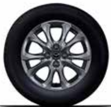
חישוקי סגסוגת 15"