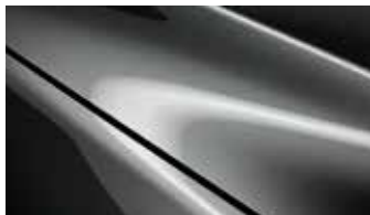
אפור עשיר (46G)*