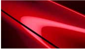
אדום עשיר נוצץ (46V)*