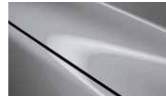
אפור בטון (52C)